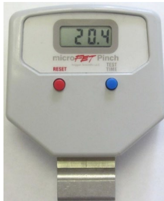
Abbildung 3. Beispiel für die Anzeige von Testergebnissen