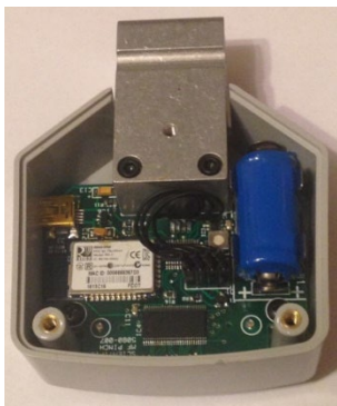
Abbildung 10. Einsetzen des Akkus