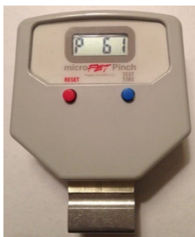
Abbildung 8. Akkuladestandsanzeige