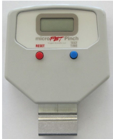
Abbildung 1. Das microFET® Pinch-Gerät