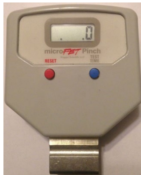
Abbildung 6. Punkt zur Anzeige eines aktiven Drahtlosmodus

Wenn das microFET® Pinch-Gerät mit der optionalen Software verwendet werden soll, müssen Software und USB-Treiber installiert werden. Die Anweisungen zur Einrichtung der Software und des USB-Treibers, enthalten im Lieferumfang der Software, sind zu beachten.