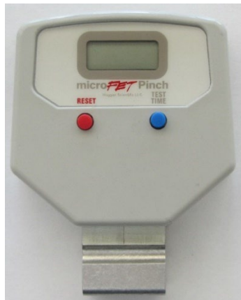
Abbildung 2. Gerätetasten/LCD-Display