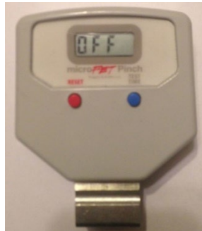
Abbildung 4. Drahtlosmodus aus