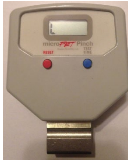
Abbildung 7. Kraftmessungsmodus