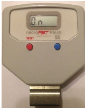
Abbildung 5. Drahtlosmodus ein